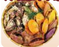
牡蠣・ヒオウギ貝 プランクトンが豊富な海で育った牡蠣。カラフルな貝殻が特徴のヒオウギ貝は、贈答用にも喜ばれます。