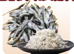
いりこ・ちりめん 豊後水道の良質な魚を厳選。豊富なミネラルとカルシウムを多く含み、味、香りは共に上質です。