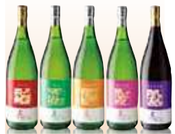
地酒・地焼酎 佐伯の山海の幸とともに佐伯のお酒をどうぞ。