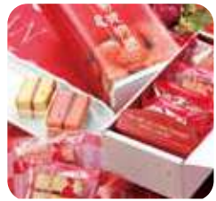
佐伯藩 菊姫物語 佐伯産イチゴを使用したブラウニー。

栄養価の高いくわの実を使って、直川地区の商工会女性部が製造しているくわの実ジャム。