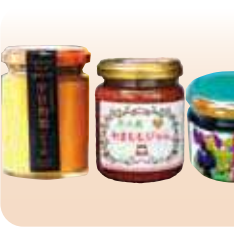
佐伯のジャム(和栗ジャム、やまももジャム、くわの実ジャム)