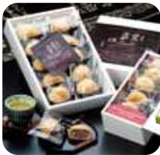
佐伯銘菓 歴史と文学の道 佐伯産大豆と塩を使用した乳菓饅頭。