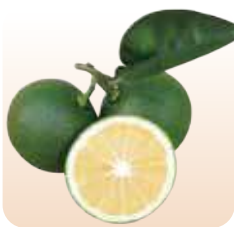
かぼす(種なし) 種がないので絞りがやすく、果汁も多い。