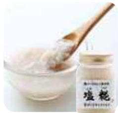
塩糍 塩糍は無添加・無着色。調理のさまざまな場面で活躍させて。