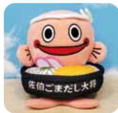
佐伯ごまだしをモチーフにした人気キャラがめいぐるみに!!