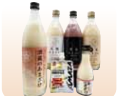
甘酒 保存料・甘味料を一切使用せず良質の米の甘さを自然に醸しだした甘酒です。