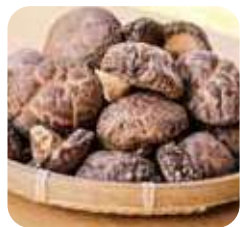
干しいたけ 肉厚で、歯切れもいい、佐伯自慢の特産品。