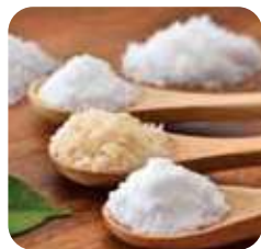
天然塩 丁寧に煮詰めて作ったミネラルもたっぷりの天然塩。