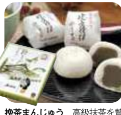
挽茶まんじゅう 高級抹茶を贅沢に練り込んだ餡を使ったお饅頭です。