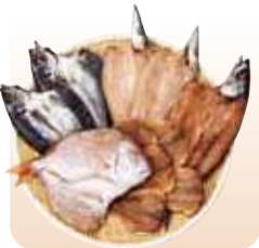
干物 アジ、カマス、タイなど、豊後水道のうまみを凝縮。