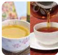
お茶・和紅茶 山間部で育まれたお茶です。