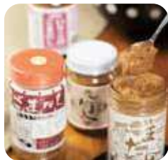
佐伯ごまだし 魚の身、胡麻をすり潰して、醤油等を混ぜて作る万能調味料。