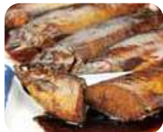
鮎甘露煮 風味豊かに甘辛く炊き上げました。鮎本来の上品な味わいをご堪能ください。